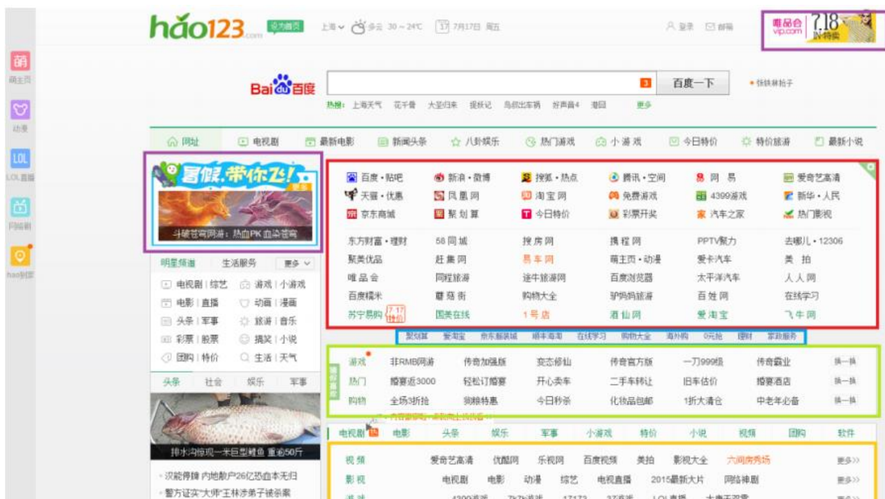
图表 1. 导航网站广告位置如下图所示(以 hao123 导航为例)

“hao123”、“搜狗”、“金山毒霸”、“2345”等导航网站均与旺翔传媒建立了稳固的合作关系,其代理的广告位类型包括名站广告位、酷站广告位、中间栏、侧边栏、Banner(网站页面的横幅广告)等按展示结算及按效果结算的广告位,可为广告主或广告代理商提供多样的广告位选择及更具性价比优势的整体广告投放策略。